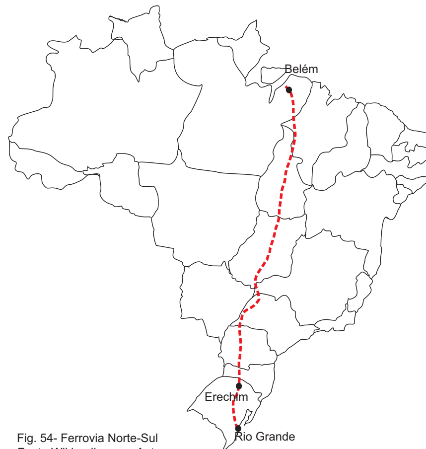
Fig. 54- Ferrovia Norte-Sul

O projeto da Agencia Nacional dos Transportes Terrestres solicitou em 2012 que a Amética Latina Logística revitalizasse a linha férrea São Paulo- Rio Grande do Sul, datada de 1900. O trecho de Marcelino Ramos à Passo Fundo no RS, será revitalizado no início de 2014. Este trecho abrange a cidade de Erechim.